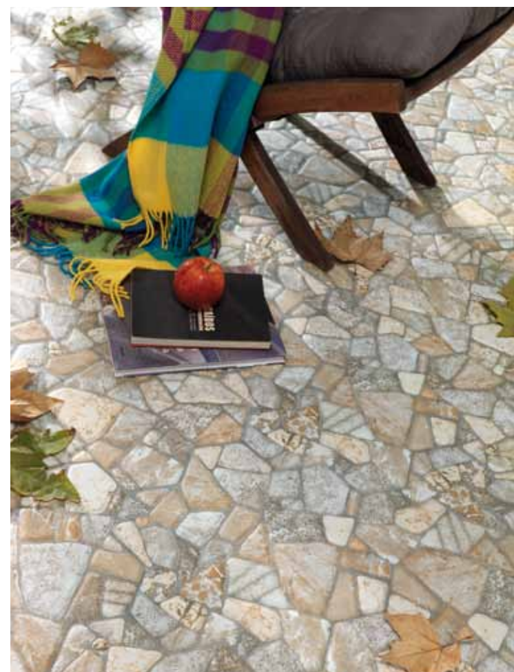
ACAMAR 40x40 cm, SERIE STAR