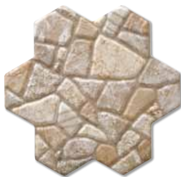
ACAMAR S008 40x40 cm.